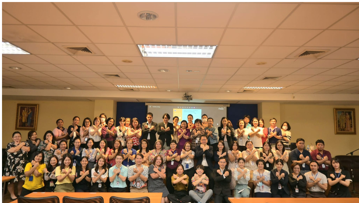
ภาพที่ 1.3 โครงการแลกเปลี่ยนเรียนรู้การประเมินคุณธรรมและความโปร่งใสในการดำเนินงาน พ.ศ. 2567

คณะกรรมการสุขศาสตร์จัดโครงการแลกเปลี่ยนเรียนรู้ การประเมินคุณธรรมและความโปร่งใสในการดำเนินงานของคณะกรรมการสุขศาสตร์ มหาวิทยาลัยมหิดล ปีงบประมาณ พ.ศ. 2567 ดังภาพที่ 1.3 นี้