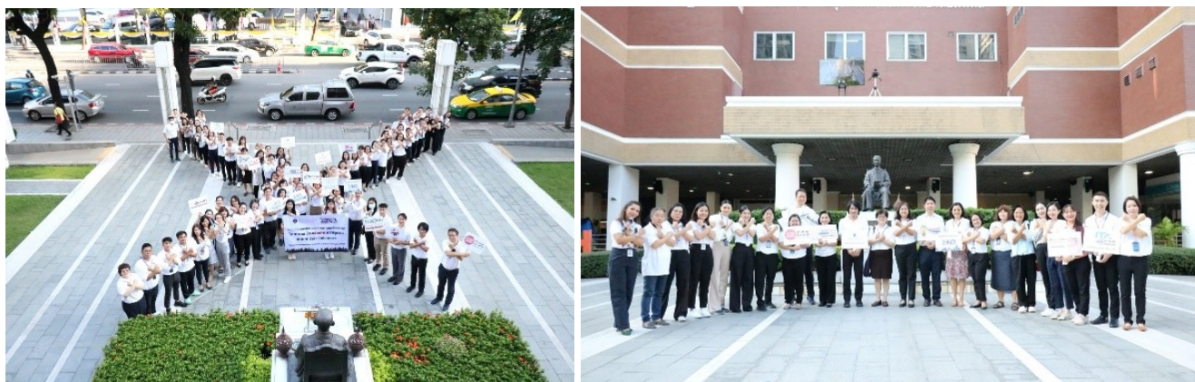
ภาพที่ 1.1 กิจกรรมประกาศเจตนารมณ์การต่อต้านการทุจริต คณะกรรมการสุจริตศาสตร์ มหาวิทยาลัยมหิดล

1.1) กิจกรรมต่อต้านการทุจริตในองค์กร และการประชุมคณะทำงาน เพื่อทบทวนและพิจารณาผลการประเมินคุณธรรมและความโปร่งใสในการประเมินคุณธรรมและความโปร่งใสในการดำเนินงานของส่วนงานภาครัฐ และข้อเสนอแนะในปีที่ผ่านมา เพื่อวิเคราะห์หาข้อบกพร่องจากการปฏิบัติงาน วางมาตรการหรือกลไกการดำเนินงาน ตลอดจนมีการกำหนดผู้รับผิดชอบให้ชัดเจน โดยคณะฯ ได้เน้นไปที่ การเปิดเผยข้อมูลสาธารณะ (OIT) เนื่องจากมีผลลัพธ์คะแนนที่ค่อนข้างน้อย แต่อัตราส่วนของคะแนนมาก และการตรวจประเมินในส่วนอื่นยังอยู่ในเกณฑ์ที่ยอมรับได้ แยกเป็นประเด็นการพิจารณา ดังภาพที่ 1.1 นี้