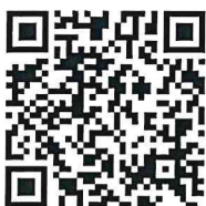
QR CODE แบบฟอร์มลงทะเบียนสำหรับผู้สนใจ